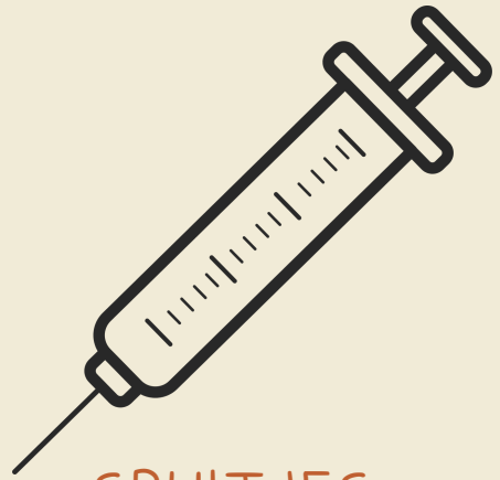
SPUITJES ZONDER NAALD